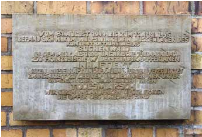
Gedenktafel am ehemaligen Außenlager des KZ Buchenwald im Equipagenweg.

Der 27. Januar ist in der Bundesrepublik seit 1996 der Tag des Gedenkens an die Opfer des Nationalsozialismus. Auch die Stadt Markkleeberg begeht diesen Tag – und gedenkt insbesondere der