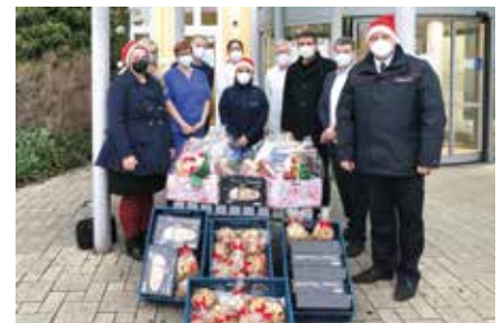
Gesundheit Danke schön für Pflegekräfte & Ärzt*innen