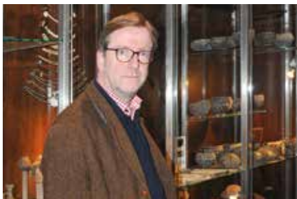
Porträt Karl Heinrich von Stülpnagel