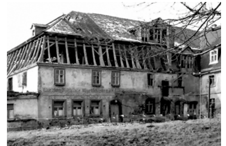
Die Stadtmühle kurz vor dem Abriss.

Nachdem die ehemalige Gaststätte „Zum Damhirsch“ in Zöbigker mangels Mittel für die Instandhaltung wertvollen Kulturgutes zur Ruine verfallen war, blieb im September 1977 nur noch der Ausweg des Abbruchs. Doch als letzten Nutzen des im Stile ländlichen Barocks gehaltenen Bauwerks registrierte der damalige Chronist gewissenhaft die Wiederverwendung von 15.000 Ziegelsteinen, 1.000 Dachziegeln und 25 Kubikmetern Holz. Für Markkleeberg gingen nach und nach viele Baudenkmäler architektonischen wie auch technischen Wertes einerseits durch den Tagebau und andererseits infolge jahrzehntelanger Ver-