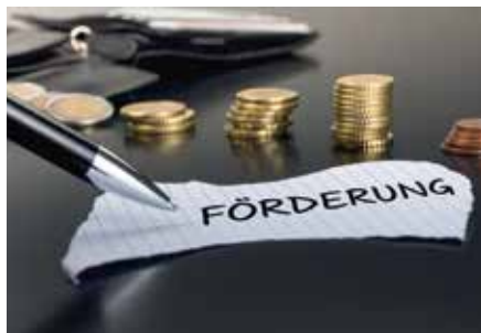
Wichtig für die Antragstellung: Zuständig sind die örtlichen Förderämter.