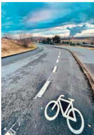
Neue Markierung oberhalb des Kanuparks.

Das Fahrrad ist als modernes Fortbewegungsmittel für verschiedenste alltägliche Wege weiterhin beliebt. In Markkleeberg ist das Fahrrad noch als ein touristisches Fortbewegungsmittel nützlich, um das Leipziger Neuseenland und vor allem den Cospudener und Markkleeberger See zu erkunden. Hier wurden in den letzten Jahren verschiedene Fahrradrouten (weiter-)entwickelt.