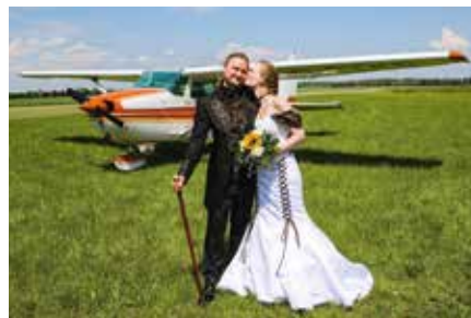
Verein Fliegerclub Böhlen e.V.