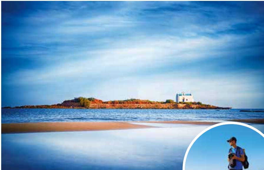
Die dem Strand von Malia vorgelagerte Insel ist bekannt für ihre kleine weiße Kapelle Afentis Cristos.